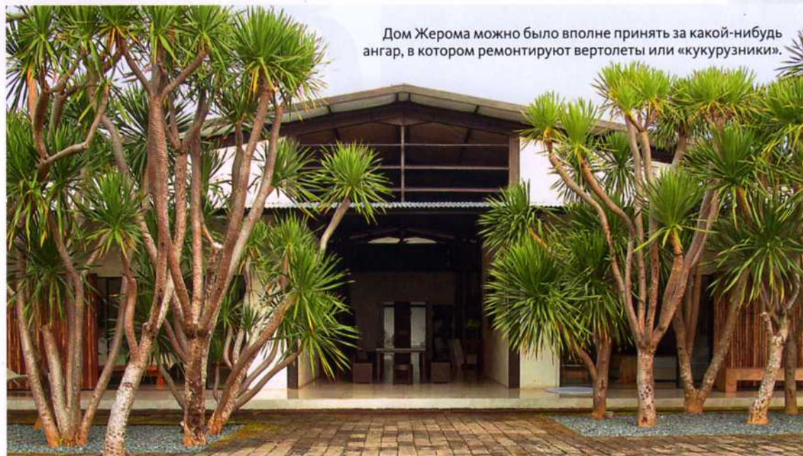
Дом Жерома можно было вполне принять за какой-нибудь ангар, в котором ремонтируют вертолеты или «кукурузники».

Как художник, Сигуин не любит «рваных» форм. Почти все его скульптуры — из единого массива дерева или металла. И дом тоже существует как единое пространство, заполненное фактически только его работами и экзотическими находками. Ну, еще чуть местной посуды на кухне. «Мне комфортно среди своих вещей — и когда люди приходят, видят их, делятся впечатлениями, мне важно, что они думают, чувствуют». И правда: к его работам тянет прикоснуться, ощутить их фактуру — будь то монументальное панно из среза древнего дерева, сильно пострадавшего от воды, или журнальный стол из поеденной коррозией ▷